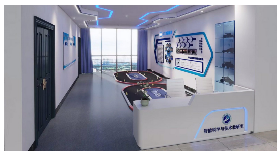
图二 实训单元示意图