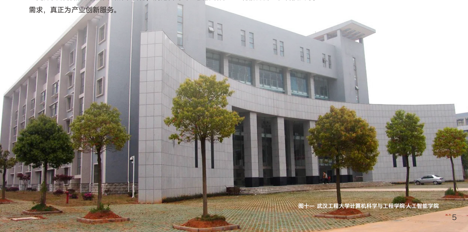
图十一 武汉工程大学计算机科学与工程学院人工智能学院

当下，随着“十四五数字经济发展规划”、“中国制造 2025”以及“新一代人工智能发展规划等重大战略的稳步推进，建设与发展“新工科”已然成为当前社会产业升级与发展的必然要求。对武汉工程大学而言，关注实证研究与相关实践，关注教师和学生两个主体，做好专业论证和专业认定，是“新工科”的研究与实践路上极为重要的一环，英特尔身为软硬件创新引领者，正通过丰富的人工智能解决方案组合和强大生态系统支持，来加速教育和科技的深度融合，以培养更多具有工程创新能力和适应未来变化能力的工程科技人才。