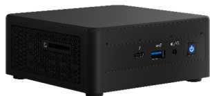
图六 英特尔下一代计算单元

如果说英特尔酷睿移动处理器是释放边缘端算力的灵魂，那么英特尔下一代计算单元就承担了“算力盒子”的使命，不仅融合了通用处理器、GPU 和 VPU 等多种异构算力平台，还可提供大量预训练好的模型库以及丰富的示例代码，并将英特尔下一代计算单元部署在实训单元内，进而开展各类场景下的数据训练。例如：在自动驾驶模型车上部署英特尔下一代计算单元，通过内置的一系列学习和 AI 开发套件，即可进行数据采集等一系列算力赋能，让学生能够更快地进行自动驾驶项目的构建。