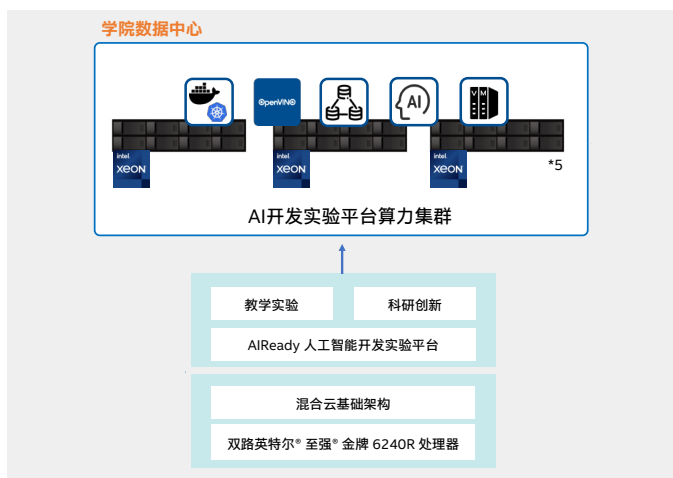
图四 校内私有云边缘示意图

首先，部署于学院数据中心的 AI 开发实验平台算力集群，可以对实验数据进行快速存储、交互和管理，并提供科研接口。不仅如此，由于教学实验平台的软件基于容器化集群构建，基础架构采用了分布式存储的解决方案，使得教学实验平台的应用层以及基础架构层都具备了高度的横向扩展能力。换言之，在高可用的同时，即便学院未来对算力资源有进一步需求，也能在不推翻现有架构的情况下无缝进行扩展。