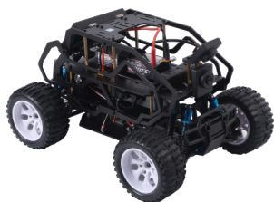
图七 自动驾驶模型小车

更重要的是，英特尔下一代计算单元具备体积小、易便携的特点，使得其不仅不占用桌面空间，甚至可以悬挂到显示器背面使用，让实用和达成完美的平衡。除了提供可靠稳定的算力支持外，英特尔下一代计算单元还能极大增强教学展示和师生互动过程的体验，让整个信息化课程教学质量获得质的飞跃。