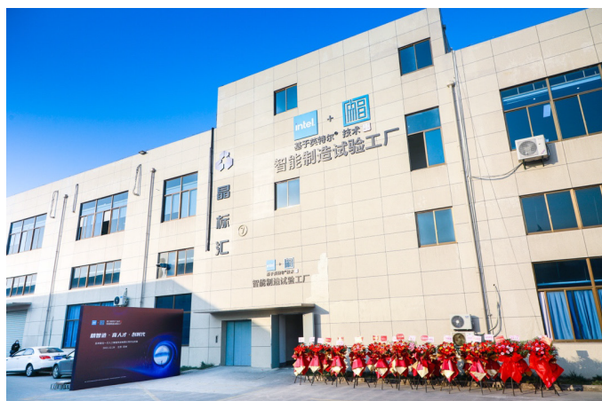
图十 英特尔与合作伙伴在江苏建设的智能试验工厂