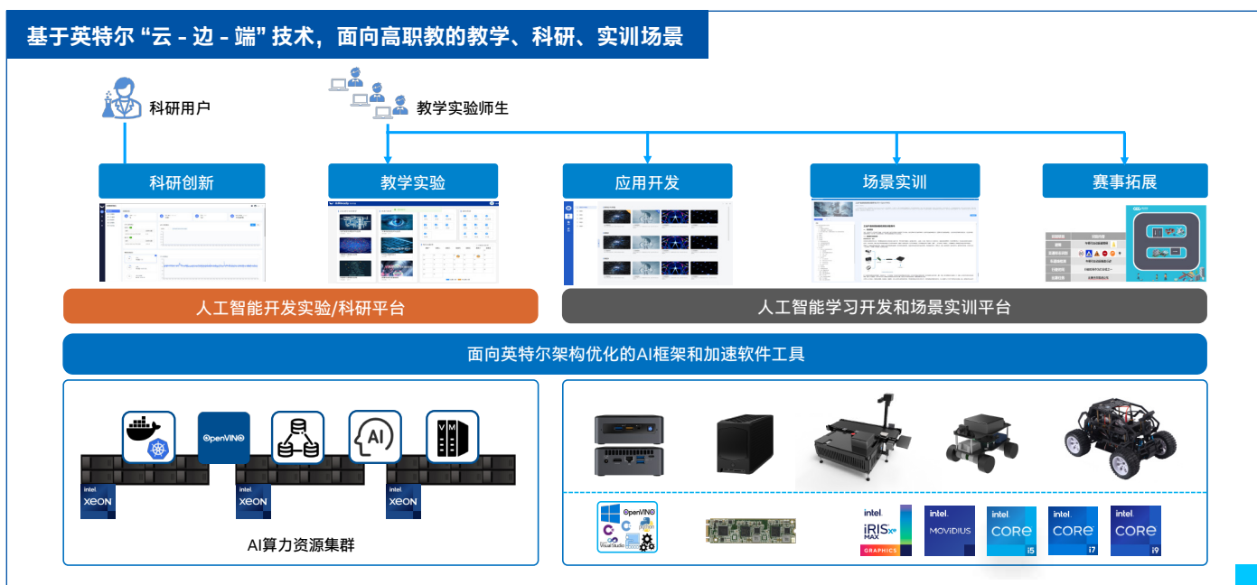
图三 英特尔端边云一体化解决方案

带来的超级算力，攻克数据收集、算法优化以及场景应用的难题，以更具实操性和场景化的平台技术，逐步提升学生的学习技能和实践水平，提高“学”的质量和“用”的成效。